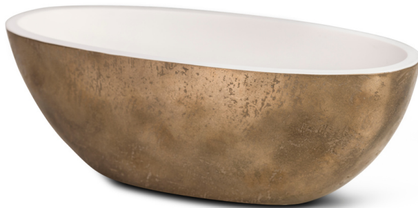
OB - Old brass