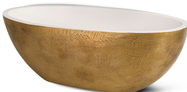
GL - Gold