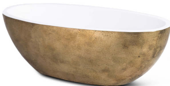
GB - Gold brass