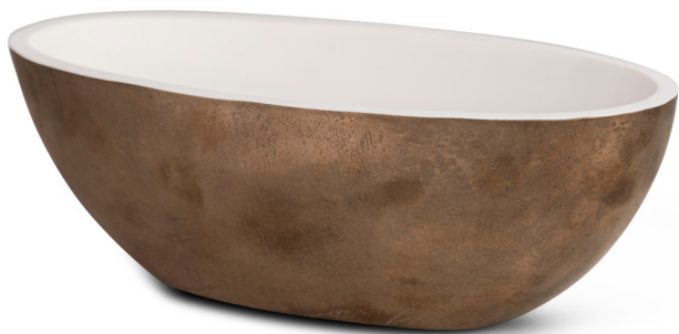
BR - Bronze