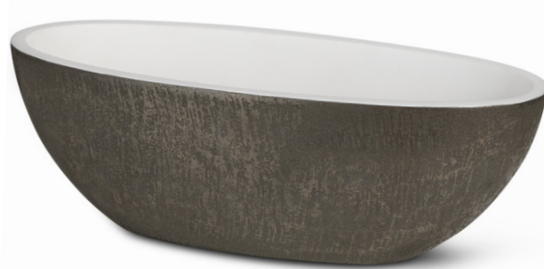
SL - Silver