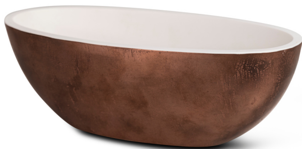
CP - Copper