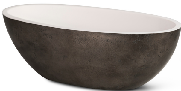
DS - Dark steel