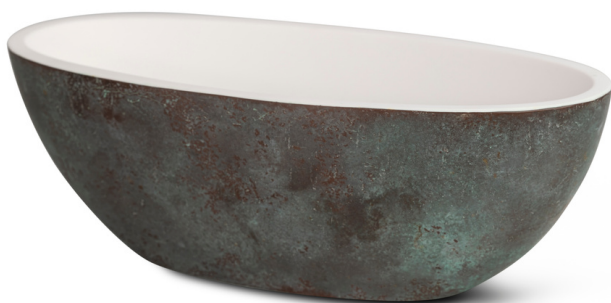
LC - Living copper